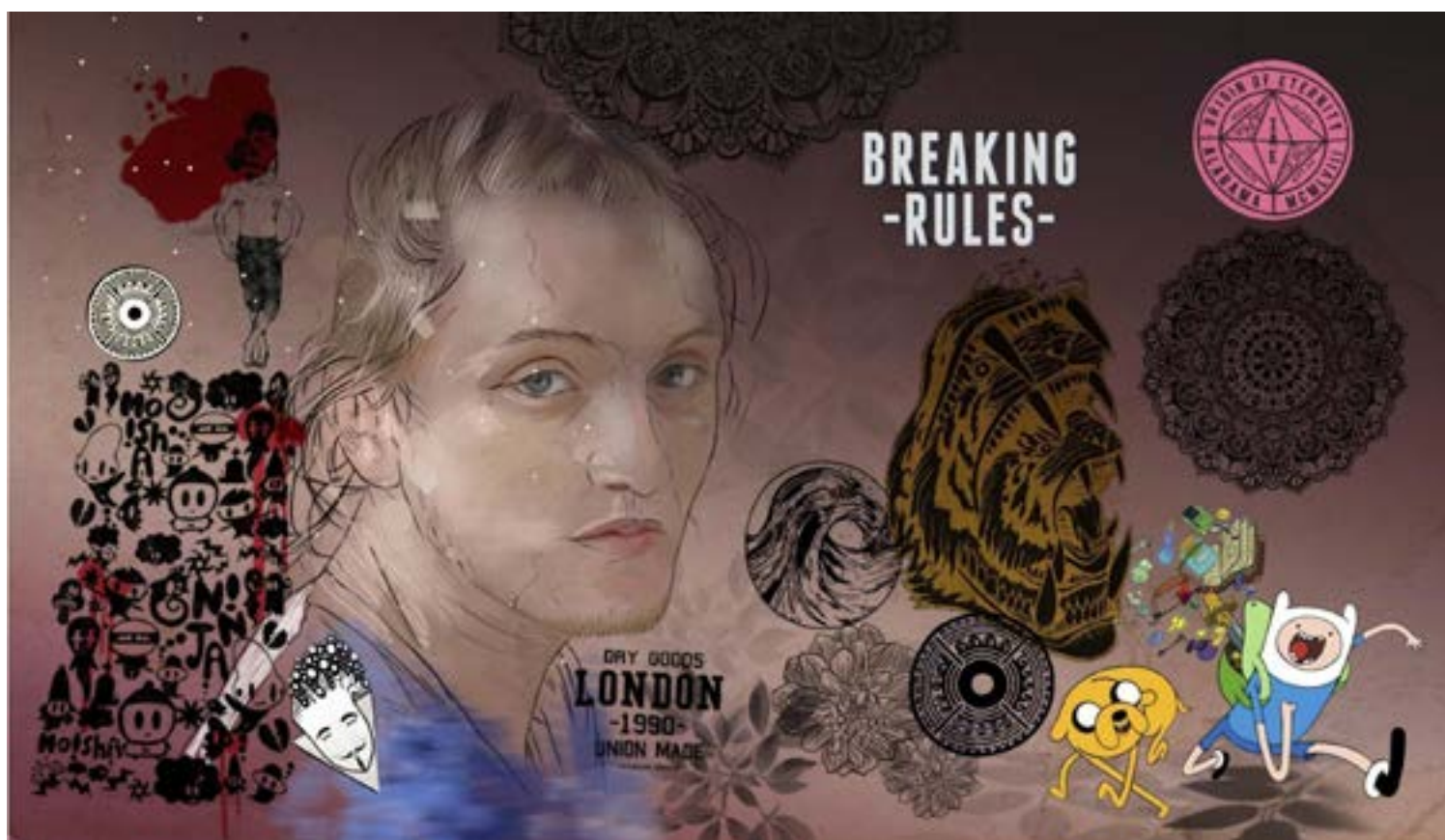
Figura 6. Composiciones visuales propuestas por medio de la co-creación.