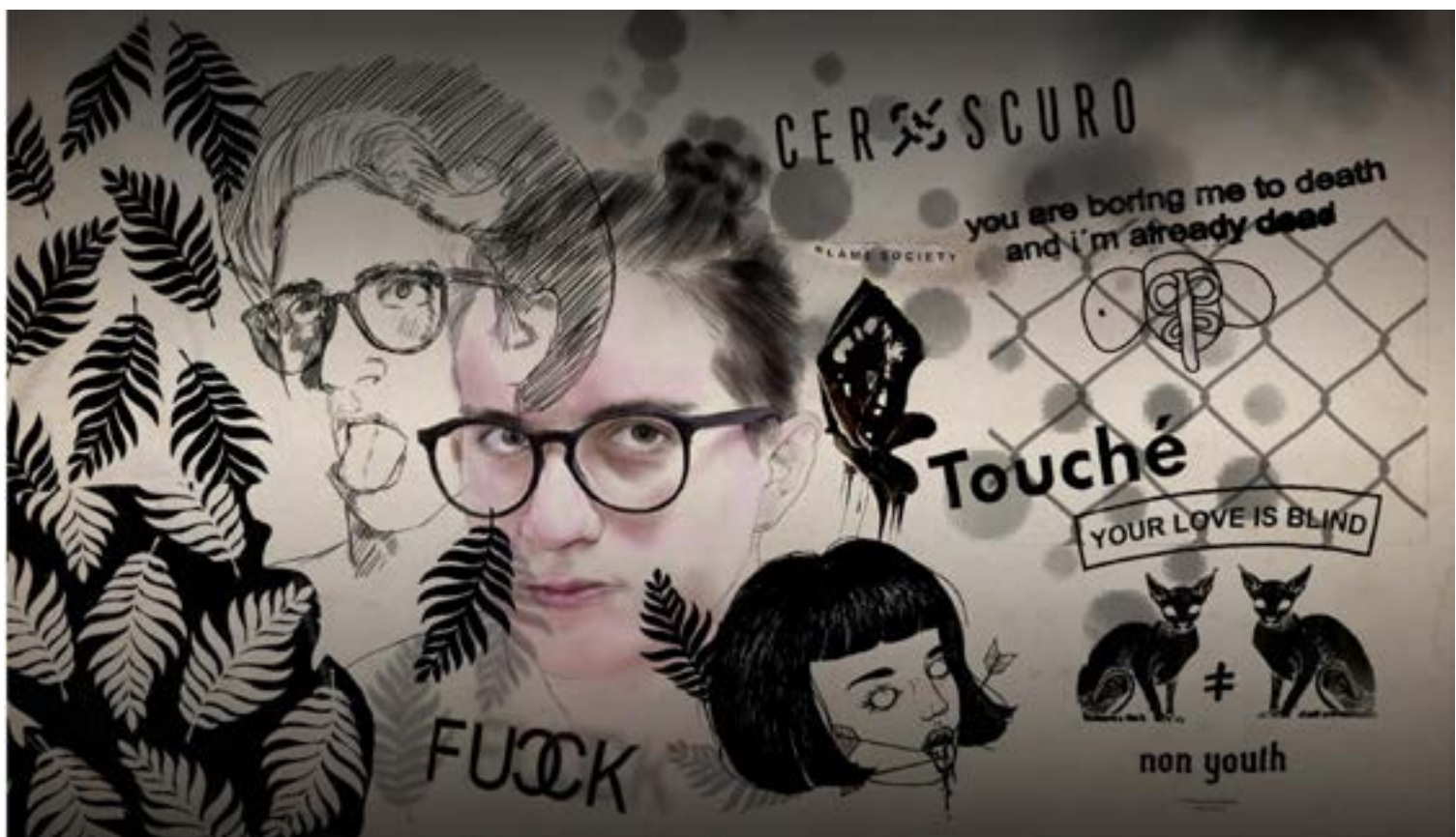
Figura 5. Composiciones visuales propuestas por medio de la co-creación.