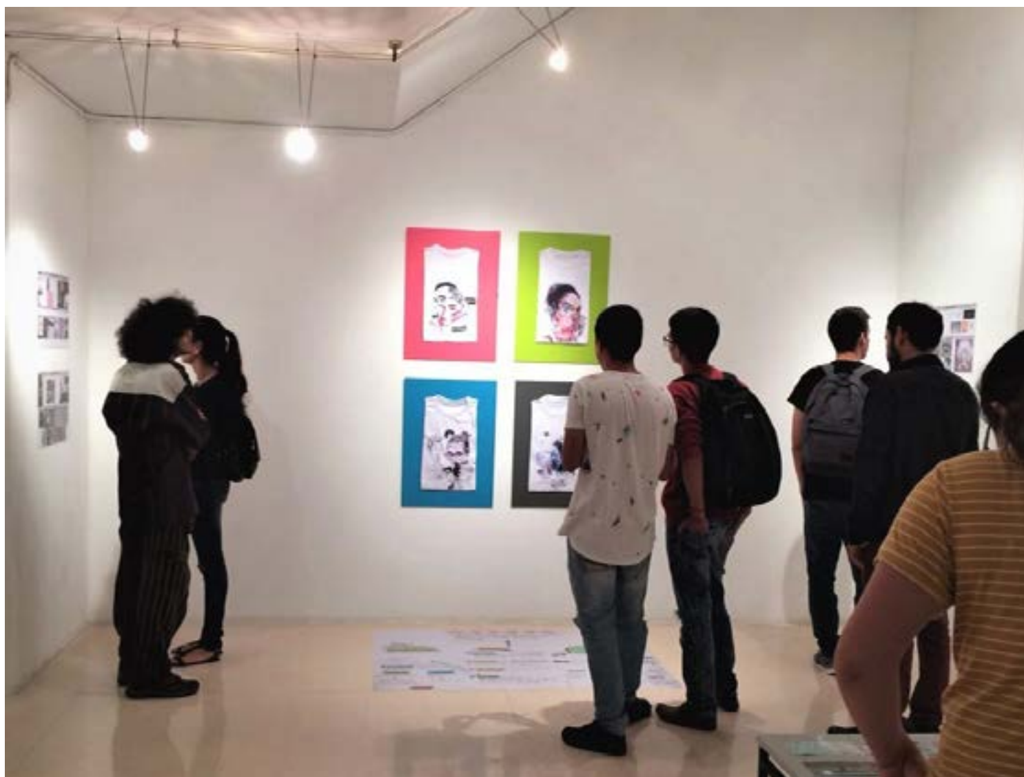
Figura 8. Exposición pública de la obra de creación

Algunos de los resultados visuales que se derivaron del ejercicio de co-creación, en los cuales diversas posturas, intereses, experiencias y lenguajes se integraron para representar las estéticas propias de los sujetos de estudio, fueron socializados a la comunidad de Pereira en el Colombo Americano de Pereira, mediante las “Exposiciones en corto”, un evento concertado con el Ministerio de Cultura, el Programa Nacional de Concertación Cultural en el Marco del Corto Circuito, Escenarios para el Arte a finales del año 2017 (Figura 8). La gran acogida del evento permitió una difusión amplia y dialogar con jóvenes que se veían reflejados en dichas composiciones visuales.