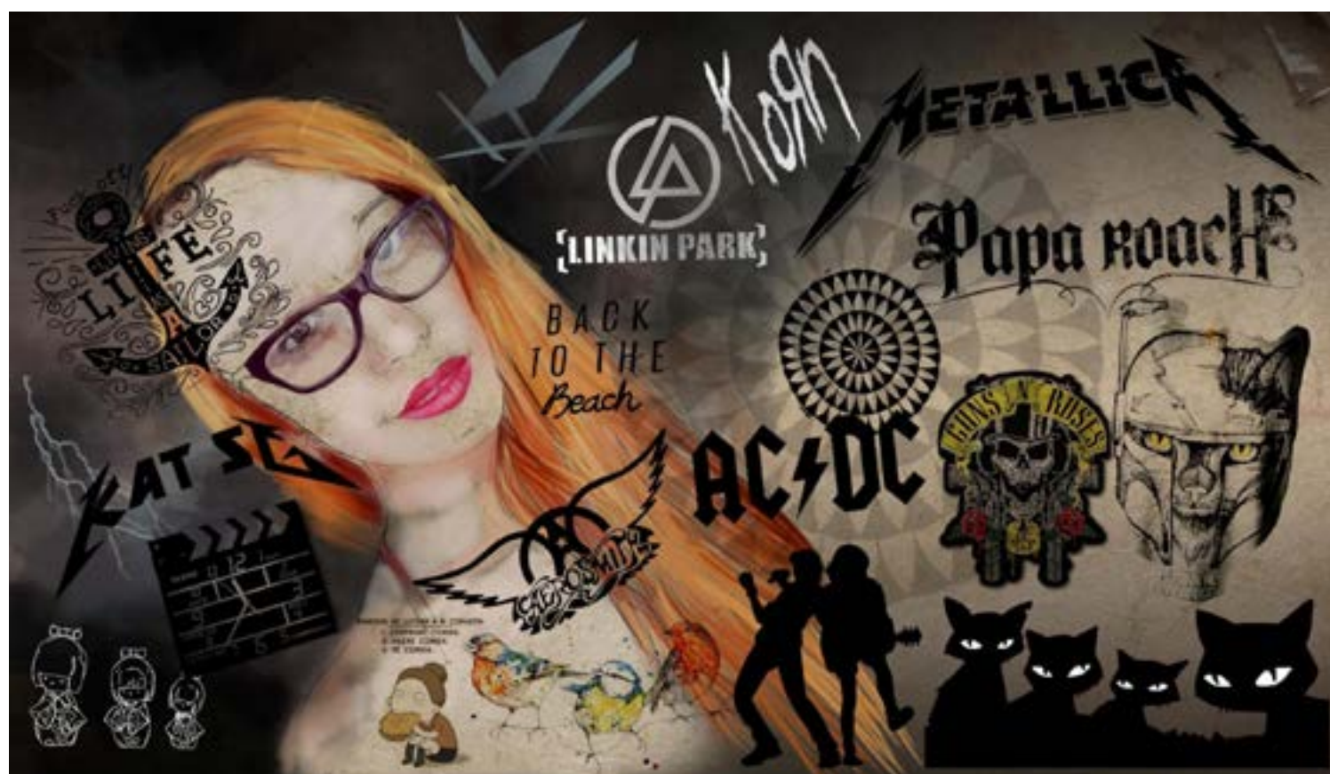
Figura 7. Composiciones visuales propuestas por medio de la co-creación.