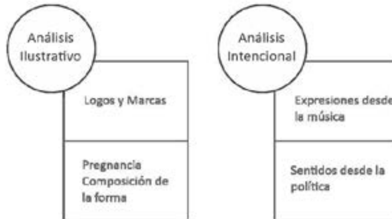
Figura 1. Esquema de análisis para la investigación. Elaboración propia.

Las tipologías de análisis y las subcategorías propuestas responden a las prácticas y expresiones socioculturales más recurrentes en la construcción de significados estéticos dentro de los hallazgos, y a pesar de existir muchas otras categorías, fueron las tipologías analíticas reiterativas en el trabajo de campo y en la configuración de sentidos de las imágenes y grafías del vestuario analizado ( Figura 1 ).