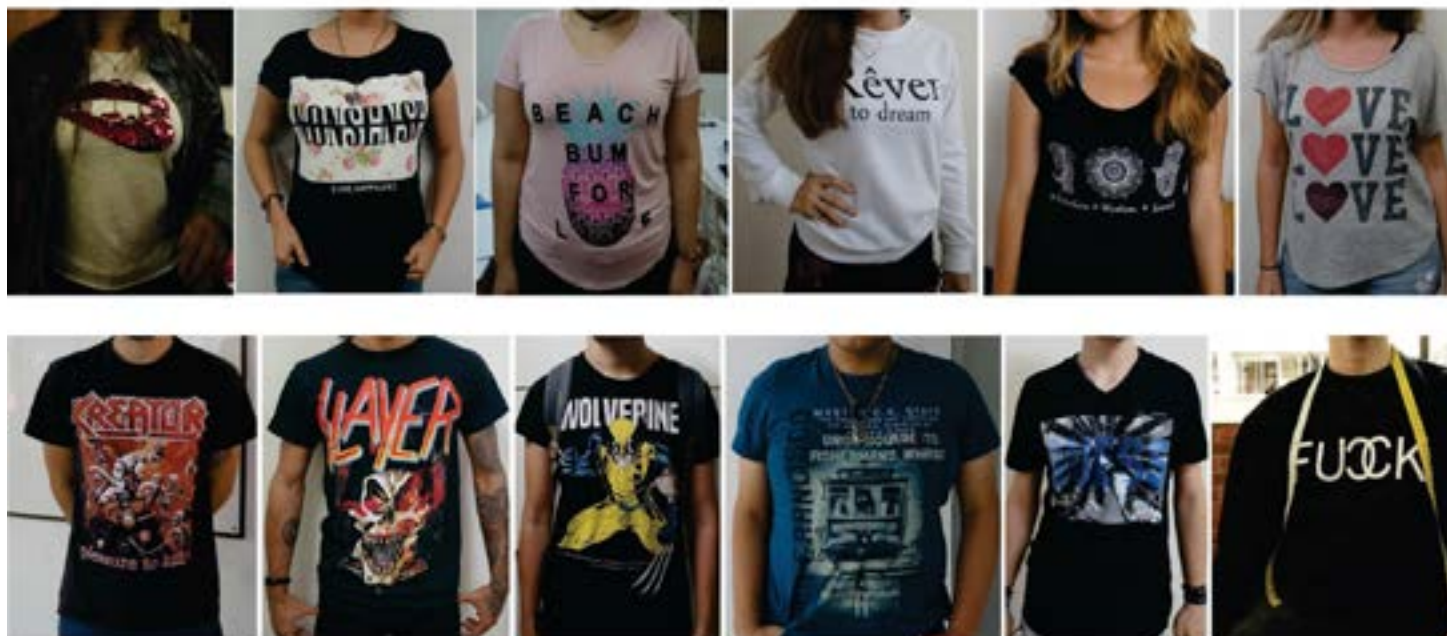
Figura 2. Registro fotográfico de las camisetas en uso. Elaboración propia.

Se realizó un registro fotográfico periódico que permitiera documentar las diferentes manifestaciones gráficas con el propósito de determinar la estética de las camisetas de los estudiantes, priorizando las grafías desde el espectro artístico y comunicativo. Posteriormente, se realizó un registro fotográfico al detalle que ordenó la información según los contenidos de los estampados de las camisetas, mediante un análisis visual que relacionaba contenido textual, imagen, ilustración y mensaje (Figura 2). Pese a la variedad de la muestra los resultados arrojaron categorías de estudio que delimitaron la investigación, entre las que se destacan: la prioridad por la marca de la prenda, el mensaje político, las formas y figuras y las preferencias personales.